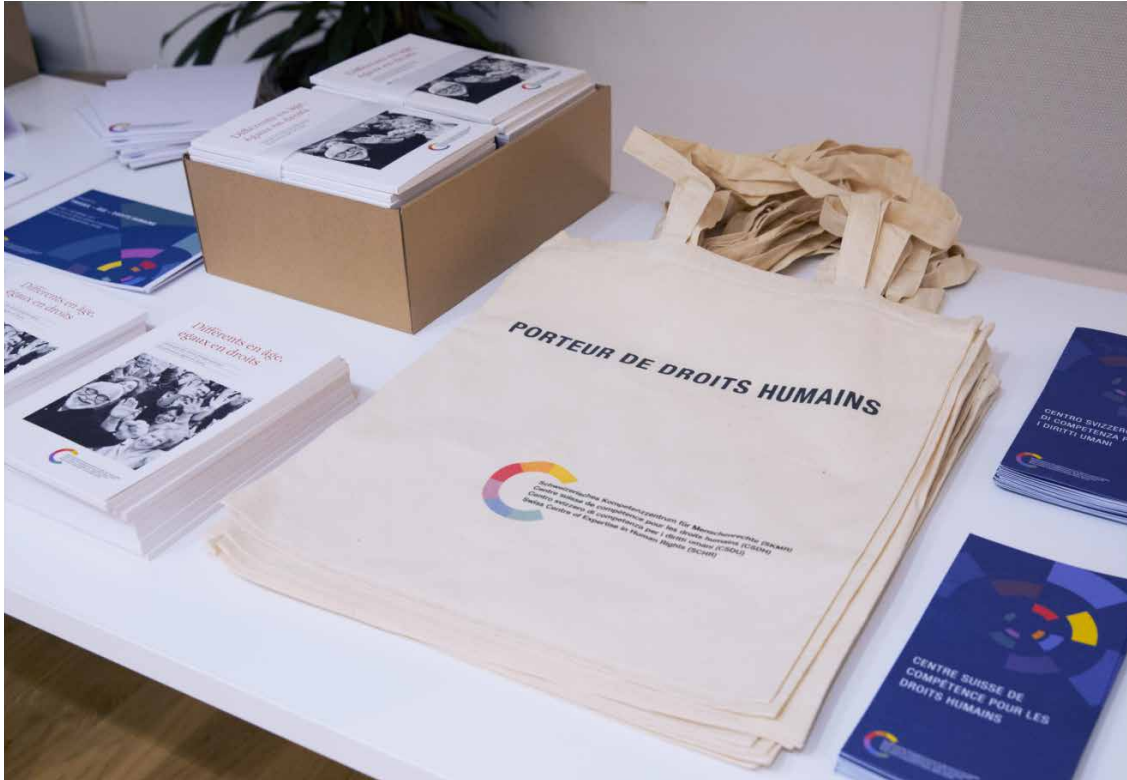
Abendveranstaltung «Arbeit – Alter – Menschenrechte» vom 7. Dezember 2017.