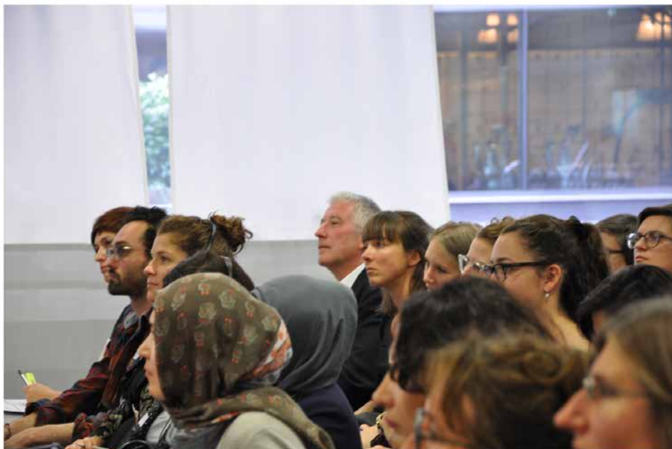
Veranstaltung «Zugang zur Justiz bei rassistischer Diskriminierung» vom 26. Oktober 2017.

Im 2018 lancieren wir weiter unseren neuen Schwerpunkt «Menschenrechte am Arbeitsplatz». Dieser soll das Spannungsfeld zwischen gesellschaftlichen, technologischen und wirtschaftlichen Entwicklungen in der Arbeitswelt auf der einen und den Vorgaben der Menschenrechte auf der anderen Seite beleuchten. Wir nehmen dabei vor allem die Auswirkungen der zunehmenden Spezialisierung und das daraus resultierende Risiko von ausbeuterischen Arbeitsverhältnissen unter die Lupe, von denen insbesondere vulnerable Personen wie ältere Menschen, Migrantinnen und Migranten sowie Menschen mit Behinderung betroffen sind. Weiter befassen wir uns mit dem Schutz der Privatsphäre am Arbeitsplatz. Diese Vielfalt an Themen führt einmal mehr vor Augen, dass die Menschenrechte für alle Teile der Gesellschaft relevant sind.