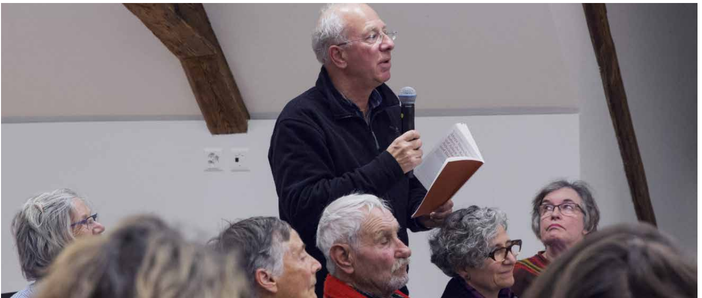
Abendveranstaltung «Arbeit – Alter – Menschenrechte» vom 7. Dezember 2017.

Für 2018 plant das SKMR weitere Projekte, mit denen die Erkenntnisse der Studie für die Praxis aufbereitet werden sollen. So ist zum einen ein Weiterbildungsangebot für Fachpersonen geplant. Zum anderen erarbeitet das SKMR mit Unterstützung der Hirschmann-Stiftung einen Praxisleitfaden. Ziel des Leitfadens ist es, dass Betroffene und Fachpersonen Grundrechtsbeeinträchtigungen im Alltag älterer Menschen besser erkennen und angemessen darauf reagieren können.