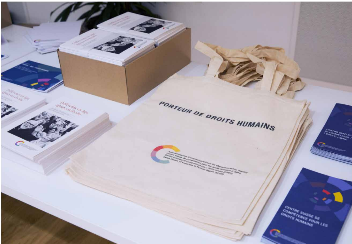
Abendveranstaltung «Arbeit – Alter – Menschenrechte» vom 7. Dezember 2017.